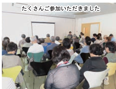
たくさんご参加いただきました

ゆうあい苑では、今後とも地域住民の皆様へお役にたつ情報を提供し続けてまいりたいと考えております。日頃介護・福祉のことでお困りの際は、ぜひゆうあい苑までご連絡下さい。 ゆうあい苑 ☎047-480-2111