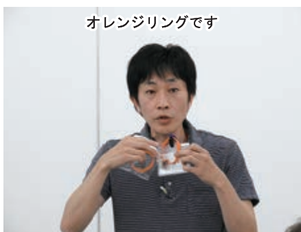
オレンジリングです