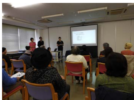
理学療法士、言語聴覚士が講師です