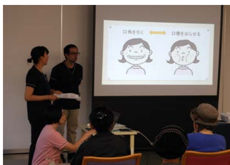
口腔機能訓練の説明