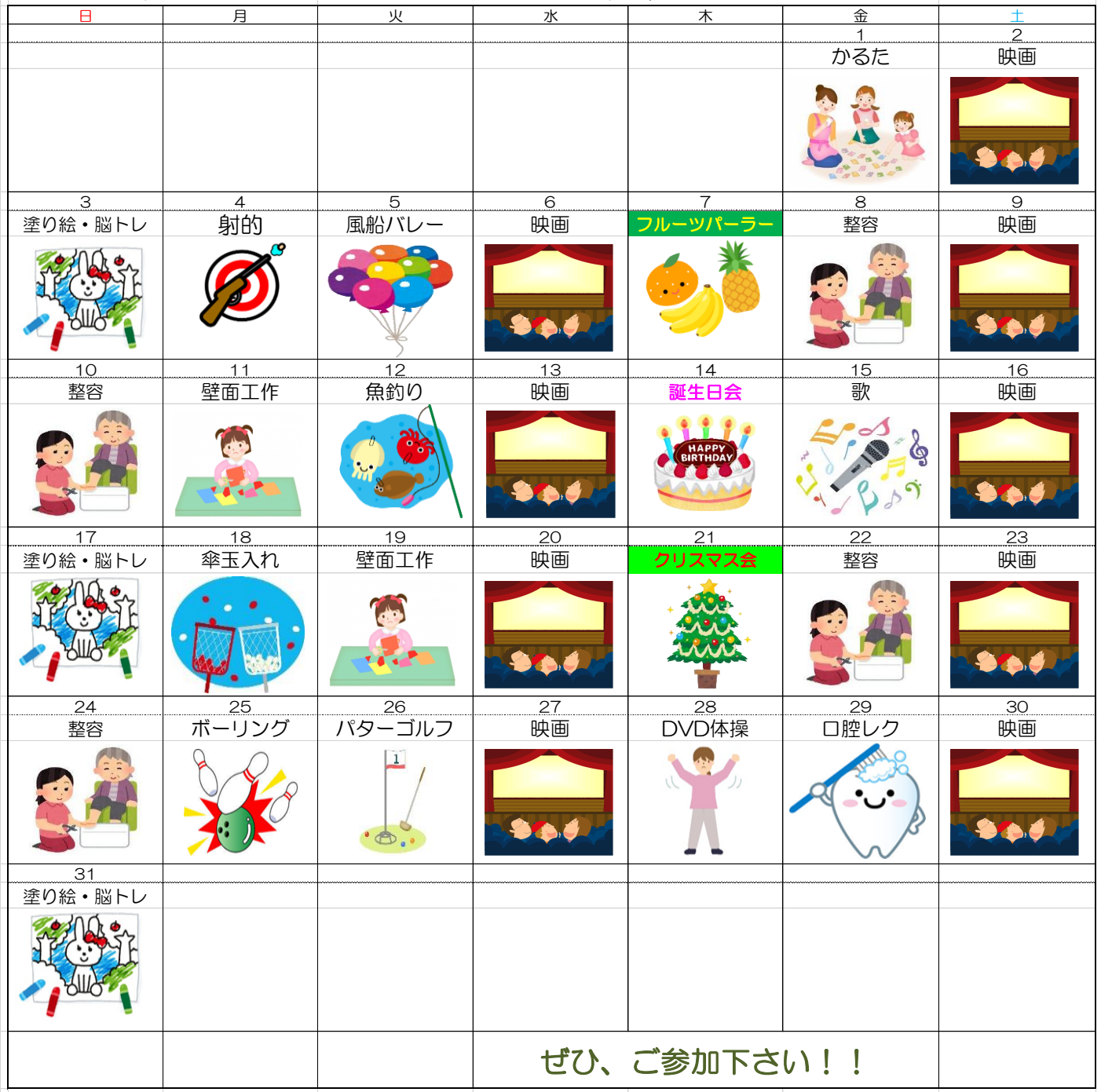
色合わせで真剣勝負