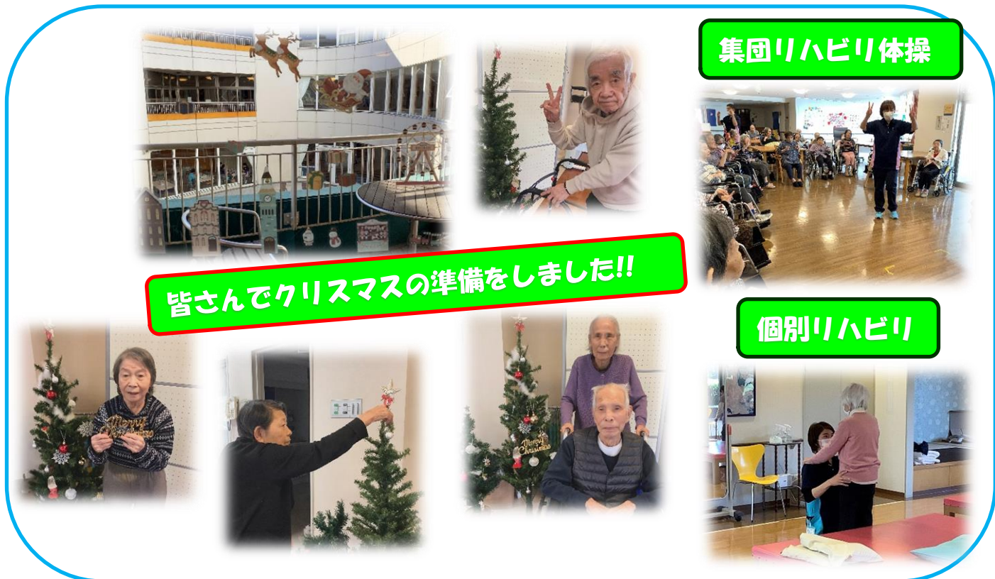
集団リハビリ体操